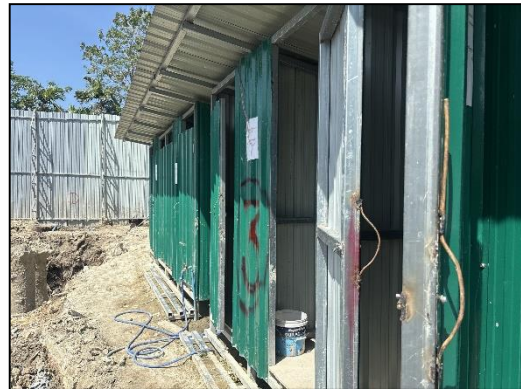
ภาพที่ 9 ห้องส้วมภายในพื้นที่ก่อสร้าง