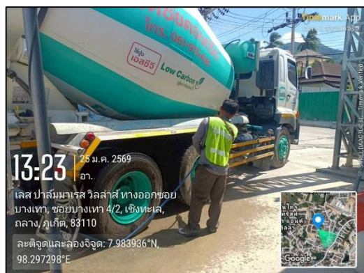
ภาพที่ 5 พื้นที่ล้างล้อ และกิจกรรมฉีดล้างล้อรถบรรทุก