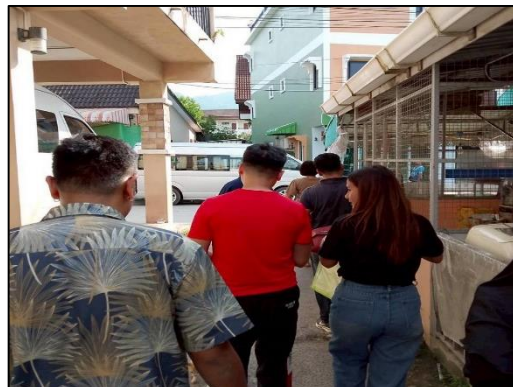
ภาพที่ 26 กิจกรรมเข้าพบผู้พักอาศัยข้างเคียงโครงการทุกเดือน