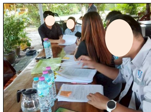
ภาพที่ 25 กิจกรรมเข้าพบผู้อาศัยบริเวณโดยรอบโครงการก่อนเริ่มก่อสร้าง