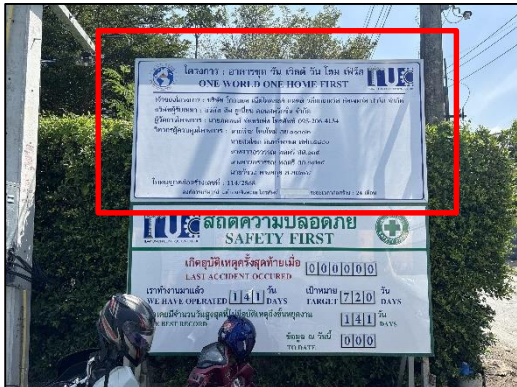
ภาพที่ 6 ป้ายประชาสัมพันธ์รั้วรายละเอียดโครงการ