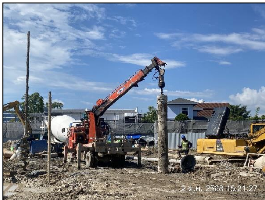
ภาพที่ 8 เสาค้ำเข็มเจาะ