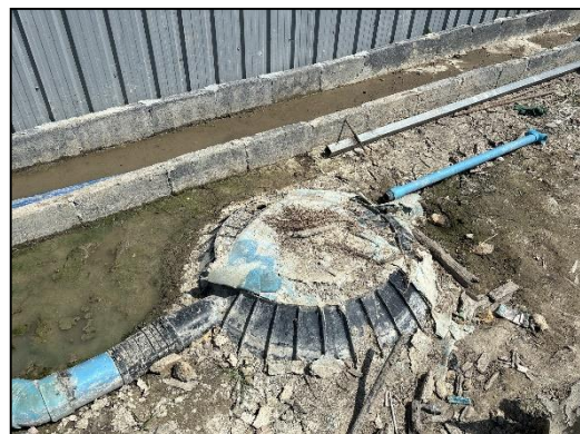
ภาพที่ 10 ถังบำบัดน้ำเสียสำเร็จรูป