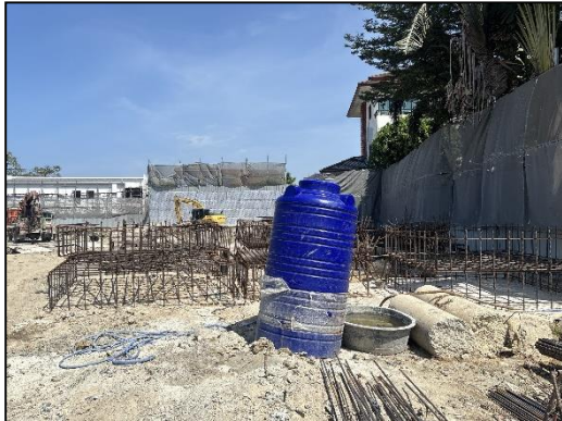
ภาพที่ 17 ถังสำรองน้ำใช้