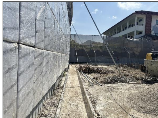
ภาพที่ 20 รางระบายน้ำภายในพื้นที่ก่อสร้าง