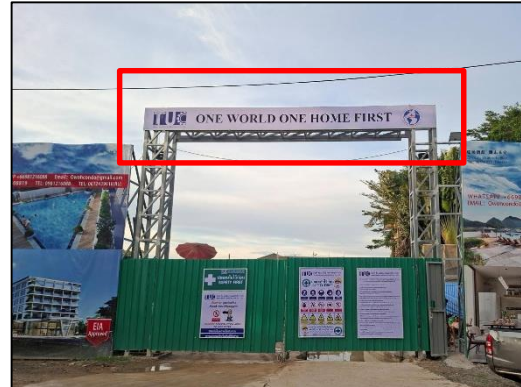
ภาพที่ 18 ป้ายชื่อโครงการ