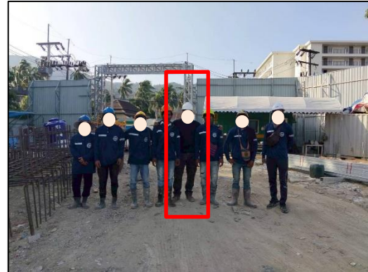
ภาพที่ 31 หัวหน้าคนงาน