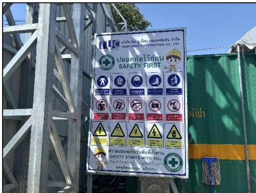
ภาพที่ 19 ป้ายเตือนอันตราย