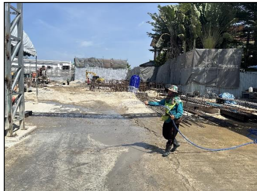
ภาพที่ 4 กิจกรรมทำความสะอาด และฉีดพรมน้ำบริเวณพื้นที่โครงการ และเส้นทางขนส่งวัสดุก่อสร้าง