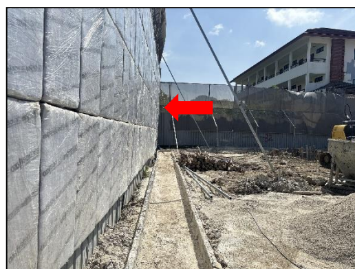
ภาพที่ 3 แผ่นกันเสียง ISO NOISE