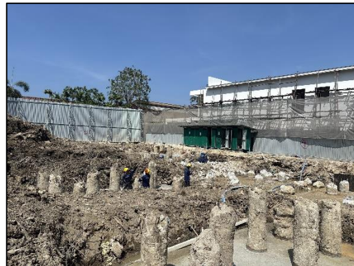
ภาพที่ 1 สภาพโครงการปัจจุบัน