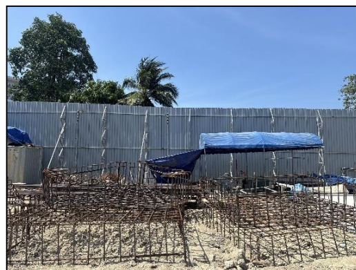
ภาพที่ 2 รั้วทึบโดยรอบพื้นที่โครงการ