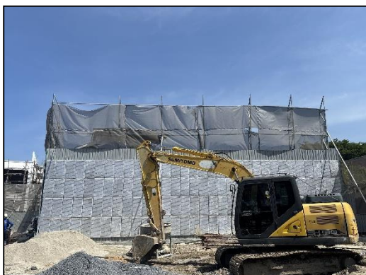
ภาพที่ 21 รถแทรกเตอร์