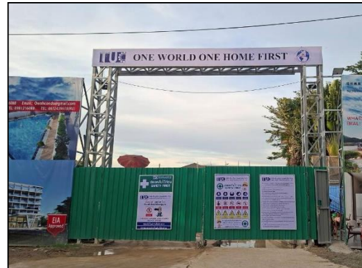
ภาพที่ 7 ประตูทางเข้า-ออกปิดทึบ