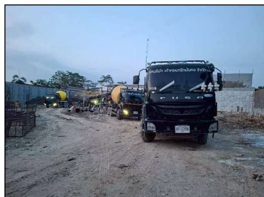
ภาพที่ 22 ถนนภายในพื้นที่ก่อสร้าง