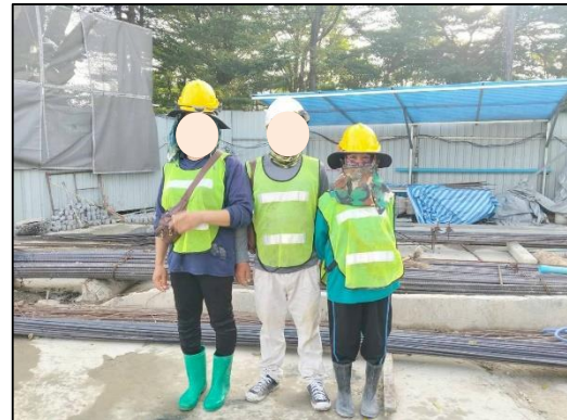
ภาพที่ 23 คนงานสวมใส่อุปกรณ์ป้องกันอันตรายส่วนบุคคล