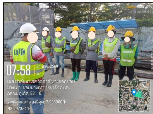
ภาพที่ 24 กิจกรรม Morning Talk